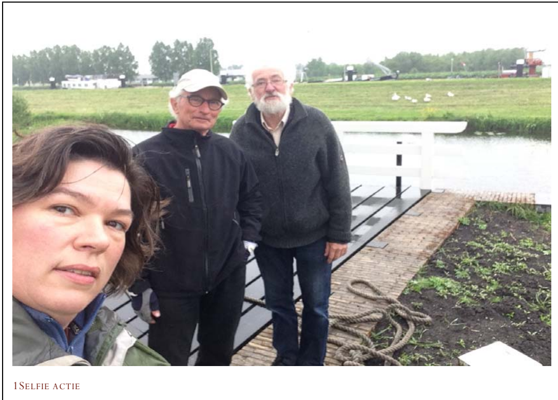
1 SELFIE ACTIE