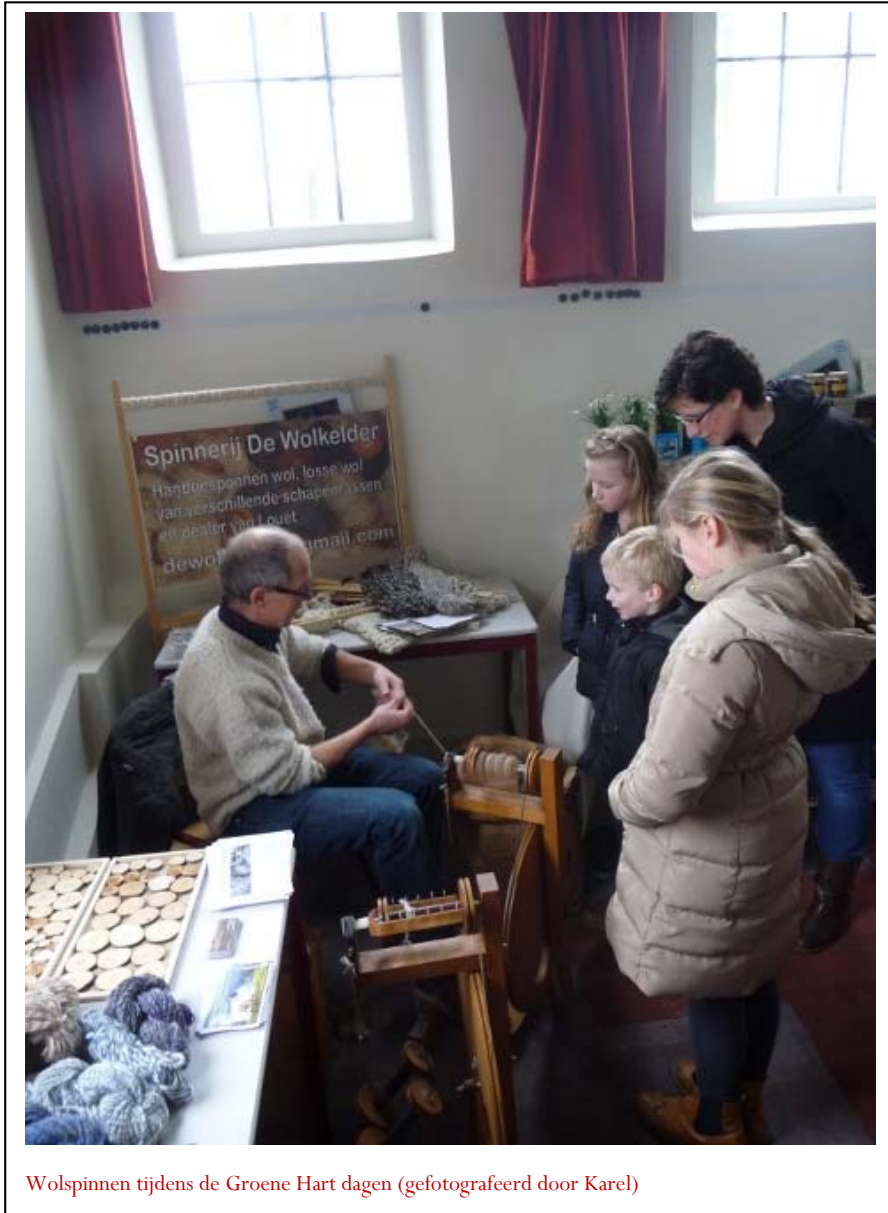
Wolspinnen tijdens de Groene Hart dagen